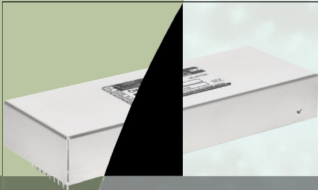
CPSmini:8W在可安装在PCB上的金属盒中 ©iseq股份有限公司