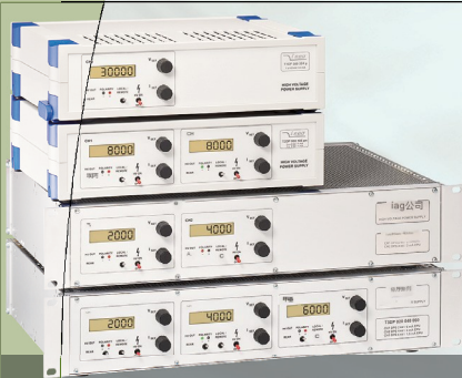
定制THQ实验室电源中的CPS模块