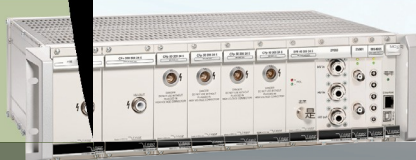
CPS 3U欧洲盒式磁带模块,装在可数字控制的19"机箱中